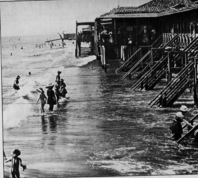
Lido di Venezia. L'ora del bagno verso i primi del secolo.